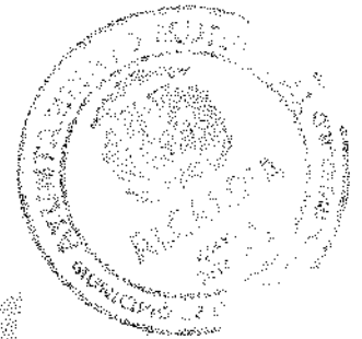
Carlos Rodrigo Matos Peña Alcalde Municipal

C/Juan Matos No.33, Municipio de Mella, Provincia Independencia, R.D. www.ayuntamientomella.gob.do info@ayuntamientomella.gob.do Tel. 809-352-4353