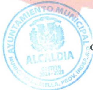
Carlos Rodrigo Matos Peña Alcalde Municipal