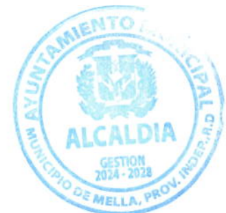
Carlos Rodrigo Matos Peña Alcalde Municipal de Mella