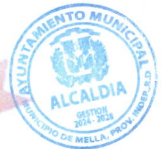
CARLOS RODRIGO MATOS PEÑA Alcalde Municipal