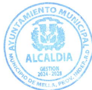
Carlos Rodrigo Matos Peña Alcalde del Municipio de Mella